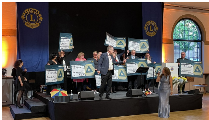
Foto: Scheckübergabe an zwölf Ludwigsburger Vereine