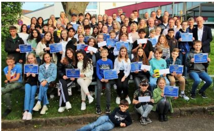
Foto „Alle Sieger“ Nach der Siegerehrung der Crailsheimer Lions-Aktion „Schule bewegt“ kamen alle jungen Leute als Vertreter ihrer Klassen zum Gruppenfoto zusammen.