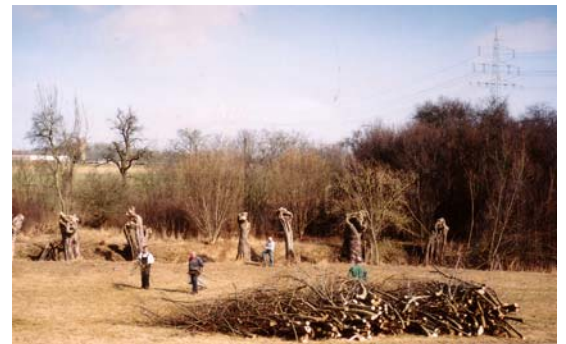
Aufgehäuft liegen die abgesägten Triebe wie eine Strecke bei einer Treibjagd

So ist es nicht verwunderlich, wenn im Laufe der Zeit auch Pflanzen und Tiere in Abhängigkeit der Kopfweide gerieten. In Nischen, Hohlräumen und Spalten sammelt sich Wasser, Zweige und Blätter und bildet die Grundlage für die Ansiedlung vieler Pflanzen und Tierarten. Verschwindet die Kopfweide nach und nach aus unserer Landschaft, verschwinden auch viele Tierarten, die sich als Kulturfolger dieser Baumform angepasst haben.. Eine Artenverarmung ist die Folge.